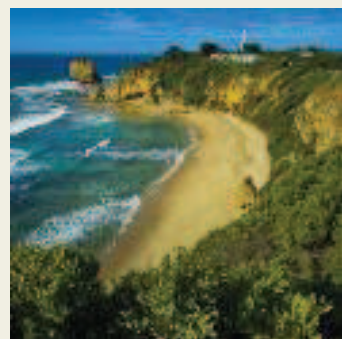
Dans le Victoria, en Australie, le Great Ocean Walk déroule falaises et formations rocheuses impressionnantes.